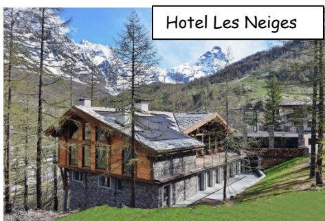
Hotel Les Neiges

Folgende Leistungen inbegriffen: Frühstücksbuffet, 3 Gang Abendmenü, WLAN, Wellnessbereich